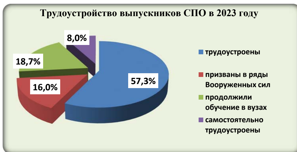
Диаграмма 8. Трудоустройство выпускников СПО в 2023 году.

Трудоустройство выпускников 2023 года отделения СПО представлено в диаграмме 8.