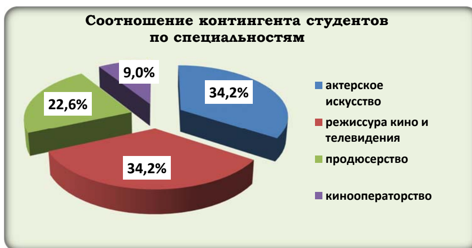
Диаграмма 1. Соотношение контингента обучающихся по специальностям

Информация о распределении контингента студентов по специальностям высшего образования представлена в диаграмме 1.