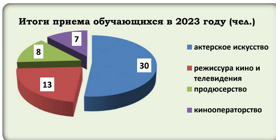
Диаграмма 2. Итоги приема обучающихся в 2023 году по программам высшего образования

Специальность 55.05.01 Режиссура кино и телевидения, специализация «Режиссер неигрового кино- и телефильма».