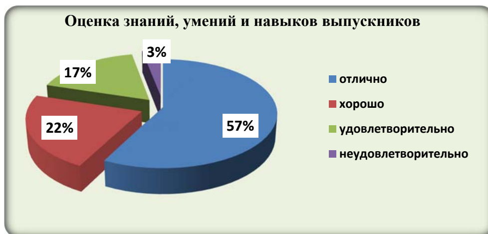
Диаграмма 4. Оценка работодателями уровня практических умений и навыков выпускников филиала (по пятибалльной системе)

уровень подготовки выпускников филиала недостаточным. Оценка работодателями уровня практических умений и навыков выпускников филиала представлена в диаграмме 4.