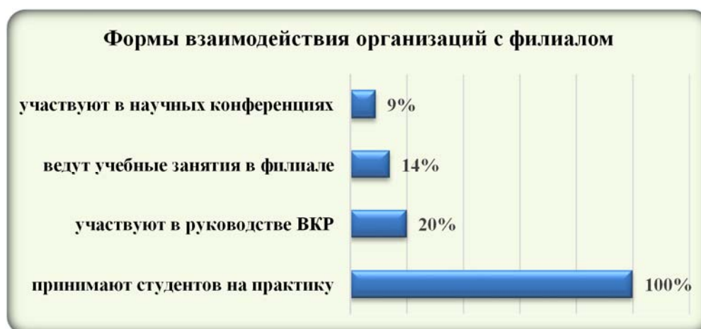
Диаграмма 3. Формы взаимодействия организаций работодателей с филиалом

Работодатели удовлетворены сотрудничеством с филиалом. Они активно участвуют в разработке образовательных программ, оказывают содействие при разработке и актуализации учебных курсов, в проведении мастер-классов, принимают обучающихся для прохождения практики. Работодатели участвуют в работе экзаменационных комиссий, по мере возможности берут к себе на работу выпускников. Формы взаимодействия организаций работодателей с филиалом представлены в диаграмме 3.