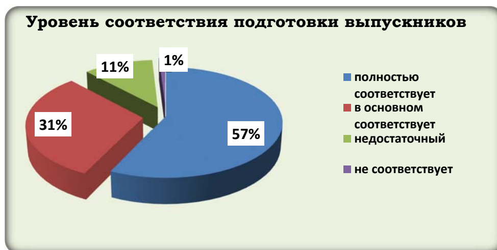
Диаграмма 5. Уровень соответствия подготовки выпускников филиала современным требованиям

Ответы респондентов об уровне соответствия подготовки выпускников филиала современным требованиям представлены в диаграмме 5.