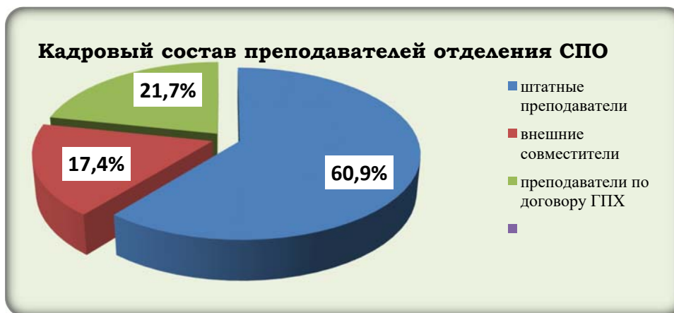
Диаграмма 6. Кадровый состав преподавателей отделения СПО.

Кадровый состав преподавателей отделения СПО представлен в диаграмме 6.